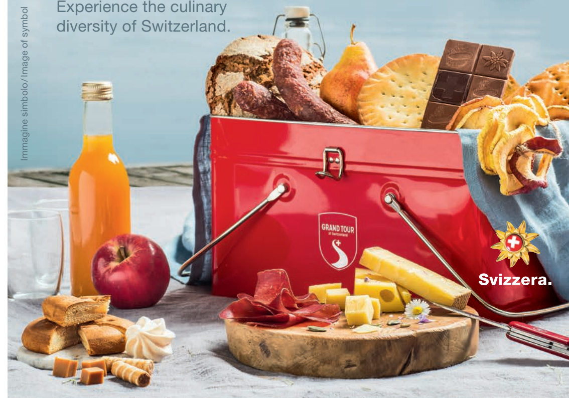
Immagine simbolo / Image of symbol

Experience the culinary diversity of Switzerland.