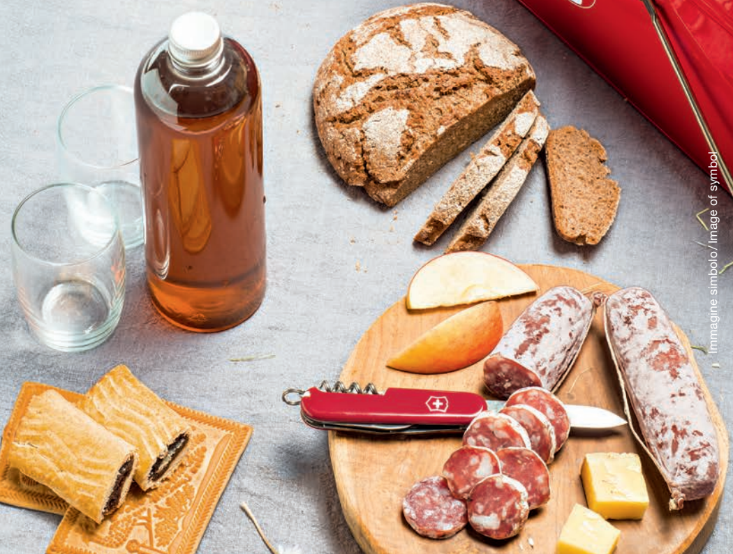
Immagine simbolo / Image of symbol